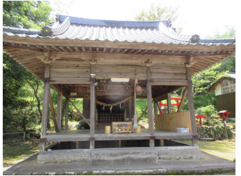
⑤生目神社 日向（宮崎県）から分霊された神社。眼病を平癒してくれるという神様。