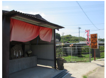
③いほ地蔵 健康長寿と美肌のお地藏様。