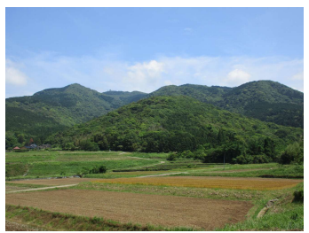
①御許山 宇佐市を代表する山。山頂部には宇佐神宮の奥宮である大元神社が鎮座する。

おもとさん まきのみね にしまき 御許山（馬城峯）の西麓に位置することから「西馬城」と呼ばれ、 熊・正覚寺・上矢部・下矢部の4つの地区（大字）が含まれます。