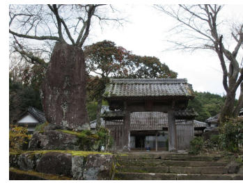
②長興寺 臨済宗大徳寺（京都）を本山とし、開山は室町時代。矢部氏の菩提寺。宝塔や五輪塔 20 基ほどがある。